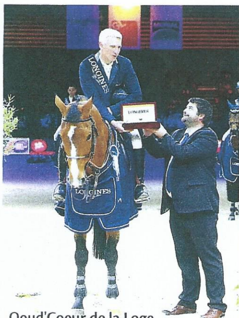
Qoud'Coeur de la Loge Vainqueur du GP-W de Lyon